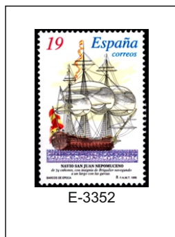
El San Juan Nepomuceno. Fue un navío de línea de 74 cañones de la Armada Española entre 1766 y 1805. Finalmente apresado en la batalla de Trafalgar por la escuadra británica.