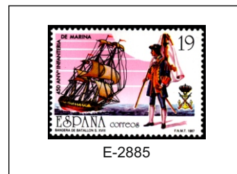
450 Aniv. de la creación del Cuerpo de Infantería de Marina.