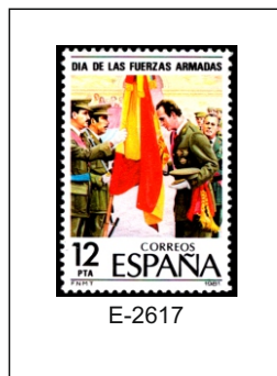
1981.- Juan Carlos I, renovando su juramento a la bandera.