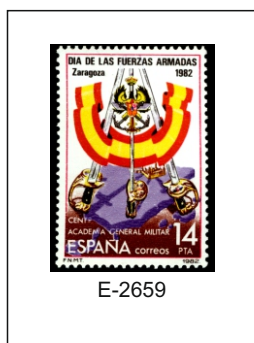
1982.- Cartel anunciador.