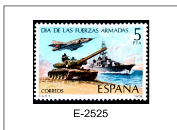
1979.- Composición alegórica de las Fuerzas Armadas.