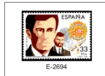
Cuerpo Superior de Policía.