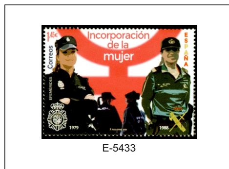
Incorporación de la mujer a la Policía Nacional y la Guardia Civil.