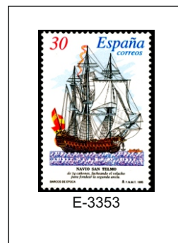
El San Telmo. Fue un navío de línea de 74 cañones. Desapareció en el cabo de Hornos en septiembre de 1819 con una dotación de 644 marineros, soldados e infantes de marina.