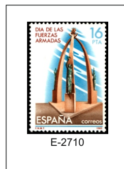
1983.- Monumento a las Fuerzas Armadas, Burgos.