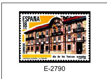
1985.- Capitanía General de Galicia, La Coruña.