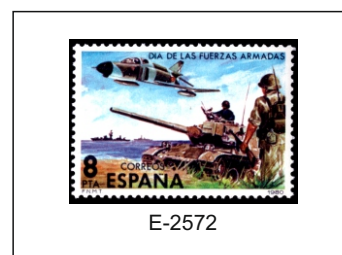
1980.- Medios de combate.