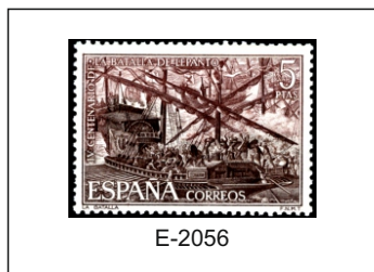
Batalla de Lepanto, por Lucas Valdés.

1971.- IV Centenario de la Batalla de Lepanto