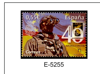
40 Aniversario del Grupo Especial de Operaciones (GEO).