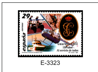
150 años de la creación de la Guardia Civil.