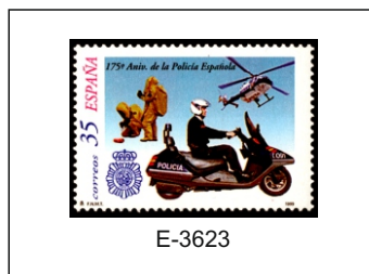
175 Aniversario de la Policía española.