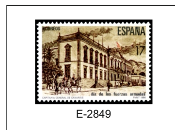
1986.- Capitanía General de Canarias, Santa Cruz de Tenerife.