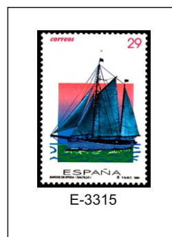
El Saltillo, que recibió inicialmente el nombre de Leander, es un queche (embarcación de vela). Actualmente es propiedad de la Escuela de Náutica de la Universidad del País Vasco, que lo utiliza como buque escuela.