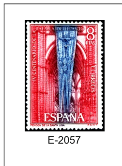
Pendón de la Santa Liga. Conservado en el Museo de Santa Cruz de Toledo.