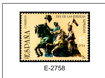
1984.- Monumento al Regimiento de Cazadores de Alcántara (Mariano Benlliure), Academia de Caballería de Valladolid.