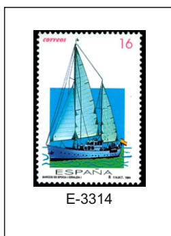
El Giralda (A-76) es un yate motovelero construido en 1958, propiedad de la Armada Española y que perteneció originalmente a Juan de Borbón y Battenberg, padre del rey Juan Carlos I de España.